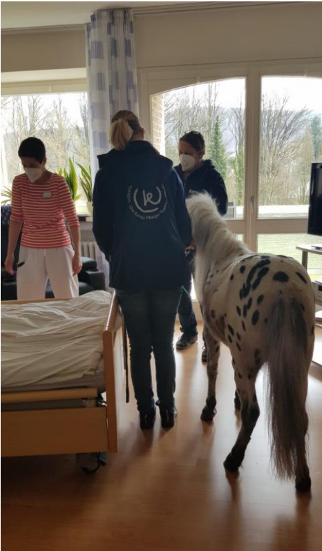
Murmel hat die Gäste zum Teil in ihren Zimmern besucht.

Weitere Informationen finden Sie im Internet unter www.hospiz-bethesda.de .